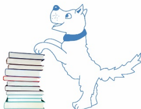
HELFENDE TIERE Leselernhunde-Team