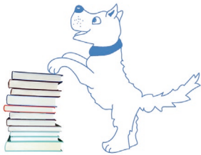
HELFENDE TIERE Leselernhunde-Team